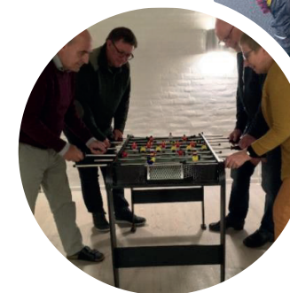
Redaktionsgruppen knokler løs – helt frivilligt!

Folderen kan også fungere som en invitation til nye tilflyttere. Og til beboere – unge som ældre – der gerne vil være med i en af de frivillige aktiviteter. Den seneste frivilligrapport viser, at aldersgruppen over 70 år er de mest aktive medborgere med 43 %, hvad der i den grad er med til at tegne et nyt billede af seniorer og ældre, som nogle der fortsat 'bidrager og giver tilbage' ikke kun som myten siger det 'bare nyder og får'.